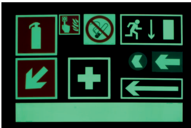
Tuotevalikoima kattaa kaikki palo-, pelastus- ja ensiapu-opasteet.